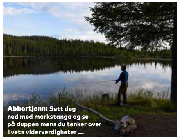
Abbortjern: Sett deg ned med markstanga og se på duppen mens du tenker over livets viderverdigheter ...