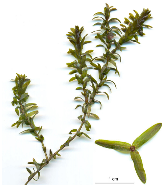
Vasspest ( Elodea canadensis ).