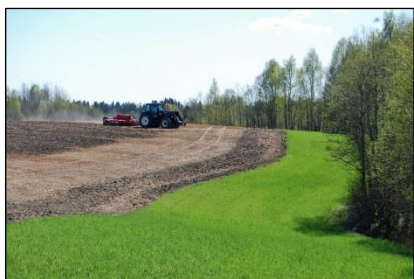
Landbruket - redusere gjødselmengdene, endre jordarbeidingen, forbedre dreneringssystemene, etablere kantsoner og fangdammer.