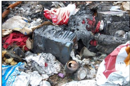
Miljøgifter - kartlegge og sette i verk tiltak etter behov fra tidligere søppelfyllinger, gruvedrift og industriutslipp.