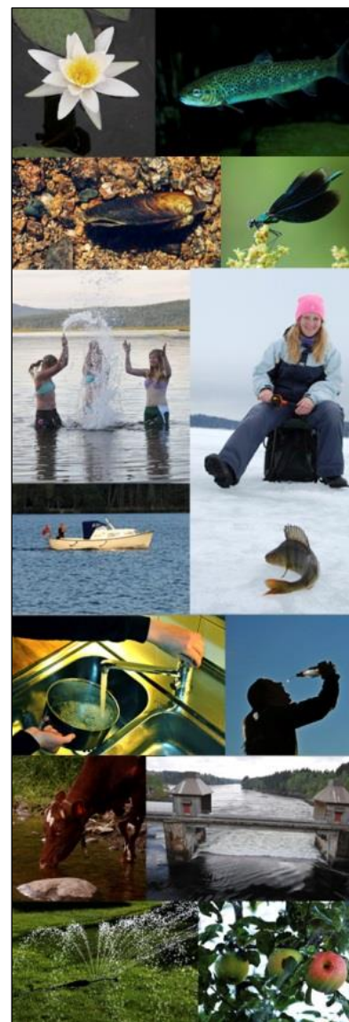
Vi er avhengige av rent, godt vann til en rekke formål.

Forvaltningen skjer nå vassdragsvis, helhetlig og kunnskapsbasert. Et svært omfattende arbeid pågår. Vannforskriften beskriver hvordan det skal gjøres, og hva som er miljømålene (§ 4 - 7). Alle vannforekomster er delt inn i