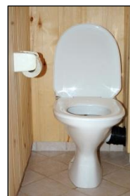
Private avløp - sørge for tilfredsstillende rensing fra private husholdninger og hytter som ikke er påkoblet det kommunale kloakksystemet.

Mer informasjon finnes på: www.vannportalen.no , www.huvo.no og i Vannforskriften (Forskrift om rammer for vannforvaltningen (av 15.12.2006).