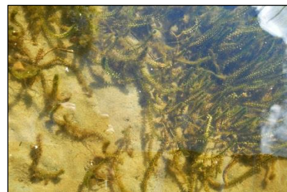
Fremmede arter - som bl.a. vasspest, må holdes under kontroll og spredning unngås.