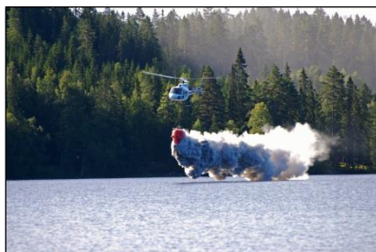
Forsuring - fortsette å kalke sure innsjøer, så lenge det er behov.