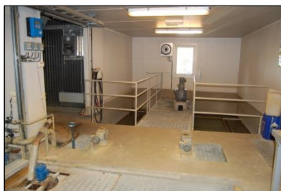
Offentlige avløp - kvalitetssikre og fornye kommunale renseanlegg, overløp og rørsystemer.